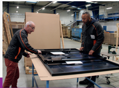
Reprise de câblage platines Électriques