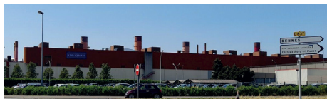
TALENDI – chez Stellantis La Janais à Chartres de Bretagne (35)