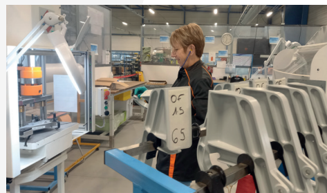
Cols de Cygne secteur aéronautique