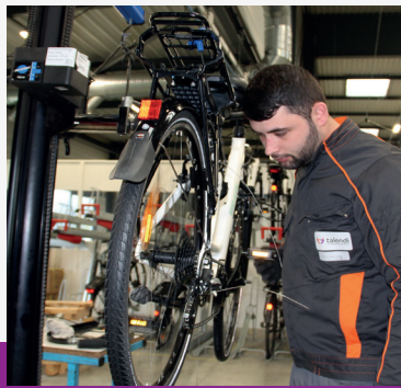
Reconditionnement de Vélo à assistance Électriques