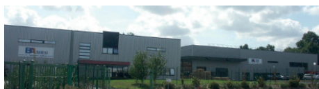
TALENDI – Rue des Prés Mêlés à Saint Erblon (35)