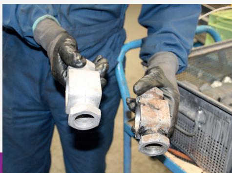
Maintenance de robinets pneumatiques

TALENDI maîtrise les techniques nécessaires à la remise en état de produits : nettoyage, diagnostique, démontage non destructif, remontage, test, traçabilité, gestion de composants neufs ou rénovés.