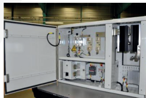
Armoire électrique secteur ferroviaire