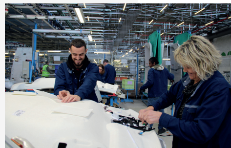
Garnitures de pavillons secteur automobile