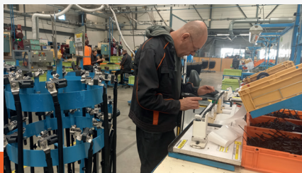
Câbles de batterie secteur automobile