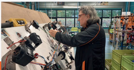
réalisation de faisceaux

TALENDI façonne une large gamme de fils et câbles conventionnels (de 0.25 à 95 mm 2 ) et spécifiques (sur demande) puis les intègre ensuite en faisceaux ou dans des sous-ensembles mécaniques de type armoire, coffret, platine.